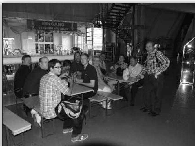
Nach knapp acht Stunden im Museum trafen sich die Mitfahrer in der Eingangshalle, um nach einem interessanten Tag die Rückfahrt anzutreten.