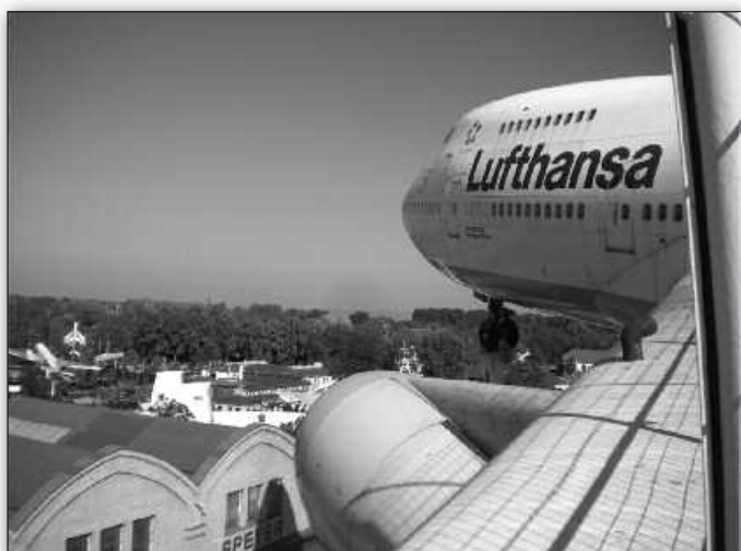
Als Blickfang ist hoch über dem Museum eine Boeing 747 angebracht. Diese war früher bei der Lufthansa im Einsatz und kann über eine Treppe von innen besichtigt werden. Auch eine der Tragflächen ist begehbar.

Ausstellungsstück ist sicherlich der russische Raumgleiter Buran, der per Schiff über den Rhein nach Speyer transportiert wurde. Auch zahlreiche andere Exponate und Modelle vermitteln Raumfahrttechnik auf anschauliche Weise. Anhand von Originalutensilien wie Astronautennahrung kann man sich ein Bild vom Alltag im All verschaffen.