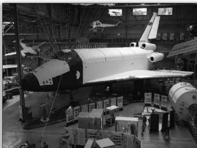
2008 ein Highlight des Museums: der russische Raumgleiter Buran.