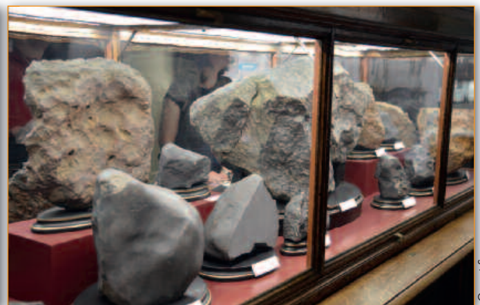
Beeindruckende Ausstellungsstücke in der Meteoritensammlung des Naturhistorischen Museums